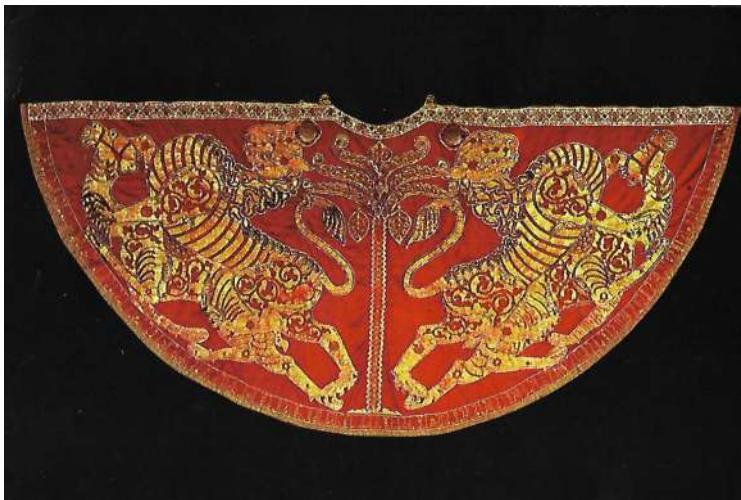
Manto di seta di Ruggero II, (tessuto dell'opificio reale) Progetto "La via della Seta".