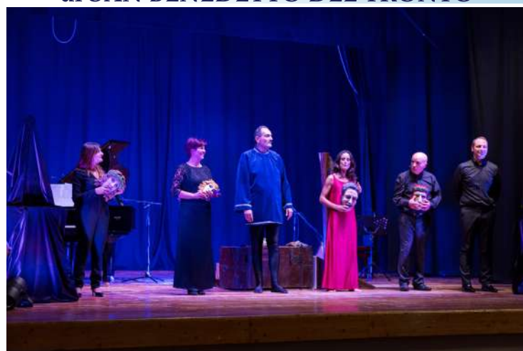
Spettacolo teatrale L'Orgoglio e la Pietà - Voci dall'Inferno di Dante