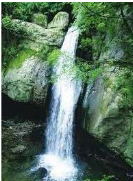
Passeggiata, storico-botanica, nella Valle del Tresinaro (Comune di Carpineti RE)

“Cascata delle Vene” le acque del torrente hanno fornito la forza motrice ai mulini della zona.