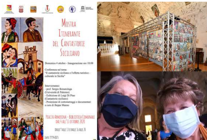
Mostra del Cantastorie Siciliano a Piazza Armerina Sostegno e speranza agli operatori della cultura Ottobre 2020