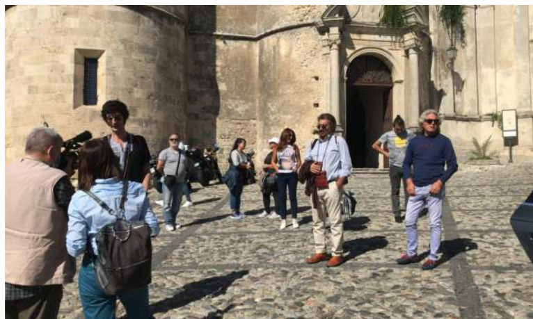
Sopralluogo del Club presso l'antico borgo di Gerace. Video intervista sul Volontariato