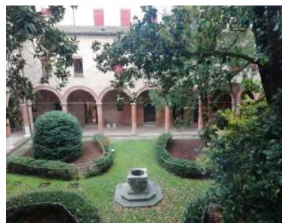
Foto del Chiostro della Piazzetta Sant'Anna di Ferrara