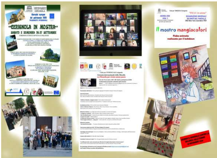
Speranza e solidarietà al tempo del covid Iniziative del Club per grandi e piccini