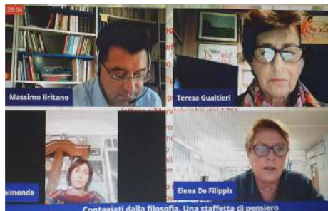
"Storia, identità, arte e biodiversità mediterranea"