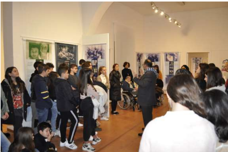
Giornata Mondiale in Ricordo dell'Olocausto