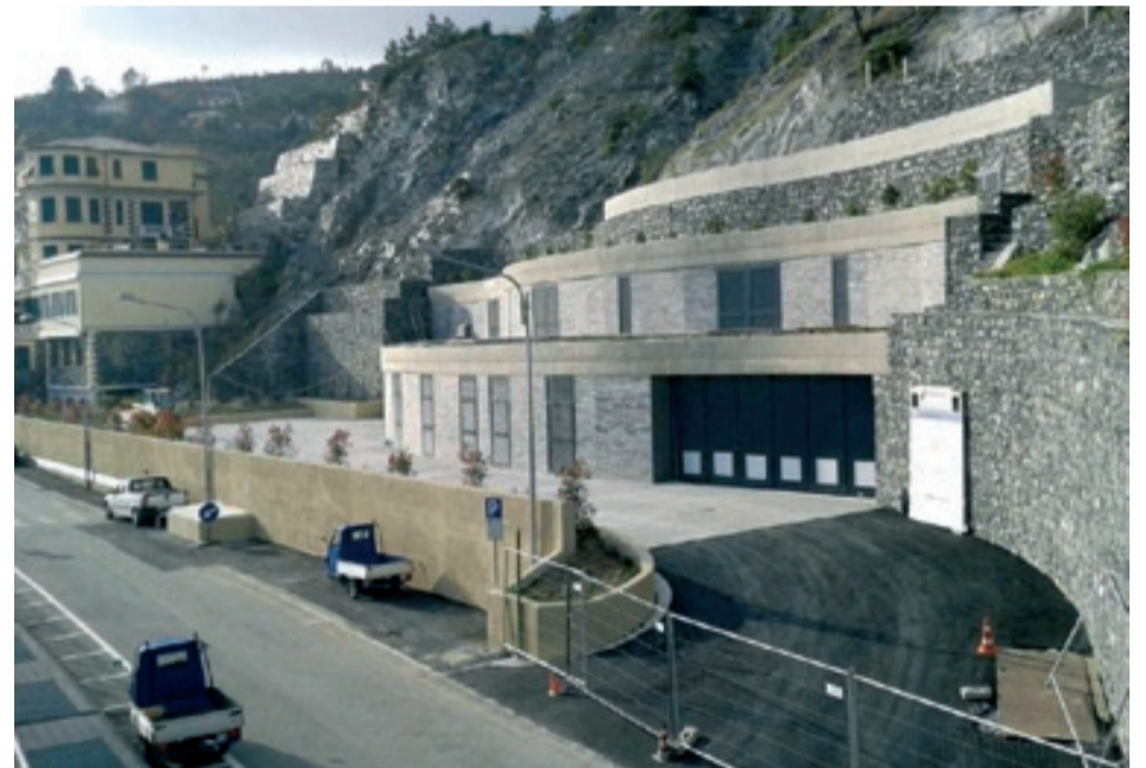
Club per l'UNESCO di LEVANTO e CINQUE TERRE

Convegno "Clima, ambiente e paesaggio. Un lusso o una necessità in tempo di crisi?" 29 marzo 2013.