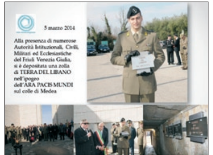
5 marzo 2014 Alla presenza di numerose Autorità Istituzionali, Civili, Militari ed Ecclesiastiche del Friuli Venezia Giulia, si è depositata una zolla di TERRA DEL LIBANO nell'ipogeo dell'ARA PACIS MUNDI sul colle di Medea

Zolla Terra del Libano all'Ara Pacis di Medea, 5 marzo 2014.