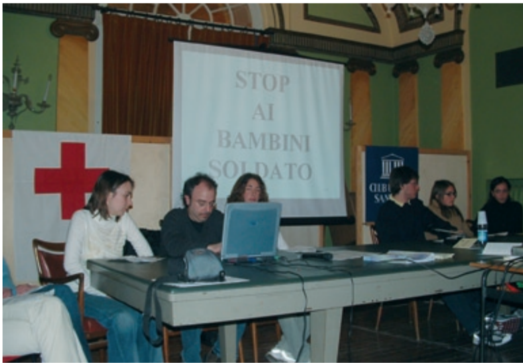
Club per l'UNESCO di SANREMO

"La Poesia del Vino: Storia, Arte... Profumi, Sapori", novembre 2018