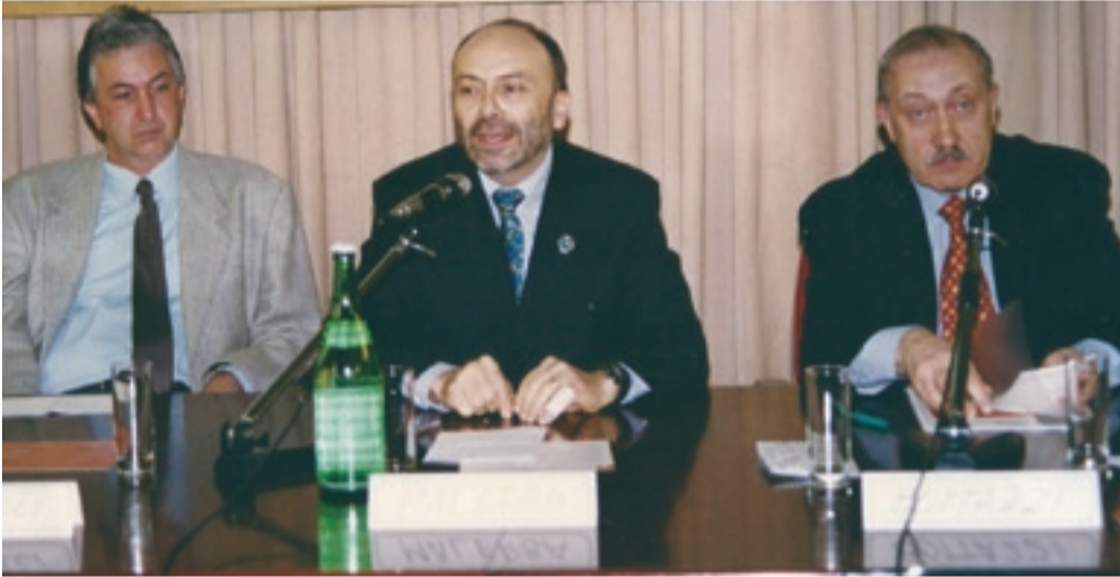
Club per l'UNESCO di REGGIO EMILIA

"Presepio delle Meraviglie – riflessione creativa su omologazione e diversità come valore fondamentale per la comunità umana", 21 dicembre 2013 - 06 gennaio 2014.