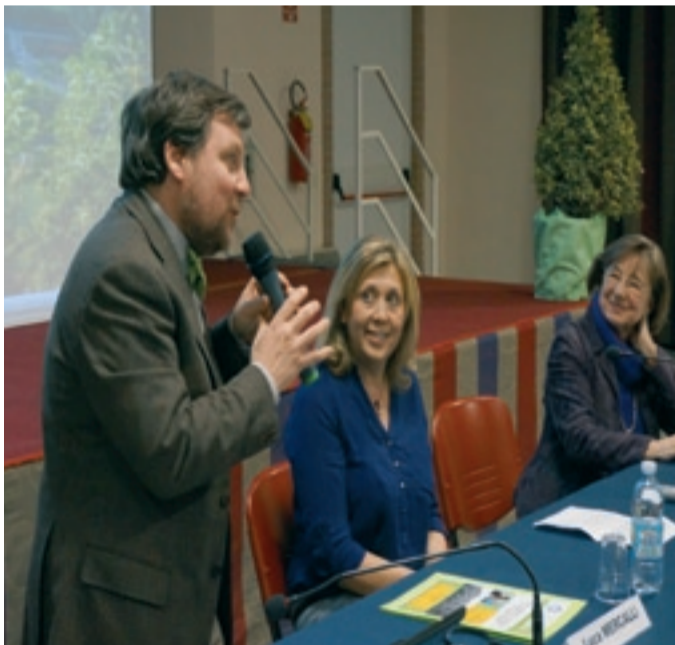
Club per l'UNESCO di LA MORRA

Convegno "Clima, ambiente e paesaggio. Un lusso o una necessità in tempo di crisi?" 29 marzo 2013.