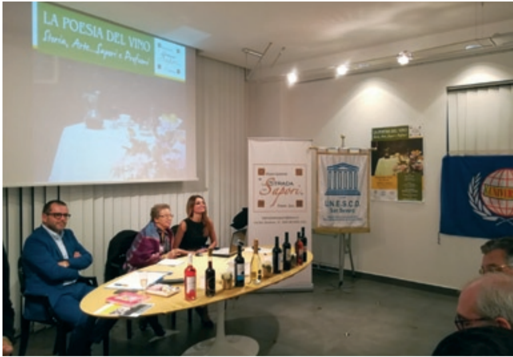
Club per l'UNESCO di SAN SEVERO

"La Poesia del Vino: Storia, Arte... Profumi, Sapori", novembre 2018