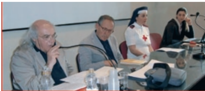
Club per l'UNESCO di CONVERSANO

Convegno di studio "La Sanità Militare e il ruolo della Croce Rossa di Terra di Bari negli anni della Grande Guerra", presso il Castello di Conversano e il Monastero di Santa Chiara di Mola di Bari, 5-6 maggio 2018.