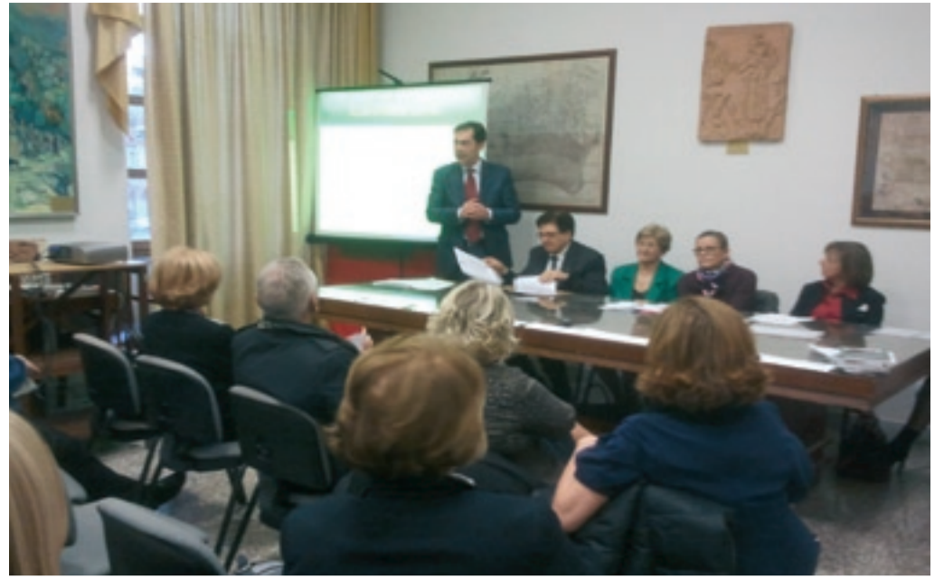
Club per l'UNESCO di LATINA

Pomeriggio a San Bernardino...un insieme di scatti nella chiesa di Proprietà Olivetti, 28 settembre 2016.