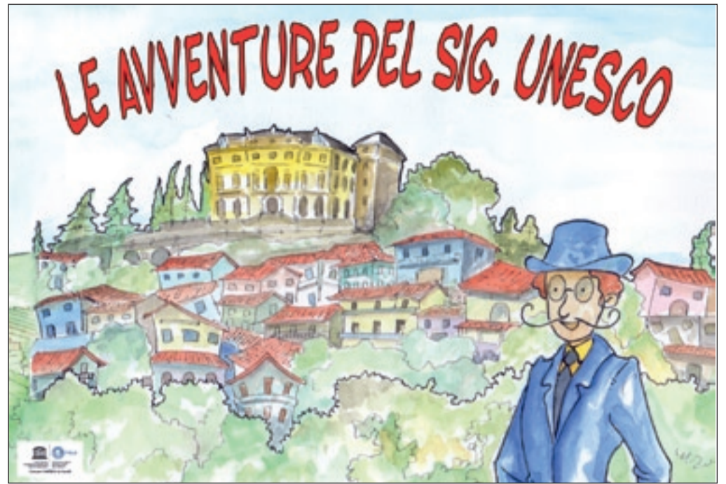
Club per l'UNESCO di CANELLI

"Rassegna Internazionale del Presepe nell'arte e nella Tradizione", anno 2018.