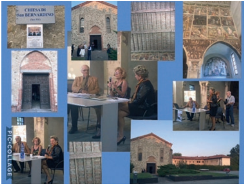
Club per l'UNESCO del IVREA

Pomeriggio a San Bernardino...un insieme di scatti nella chiesa di Proprietà Olivetti, 28 settembre 2016.