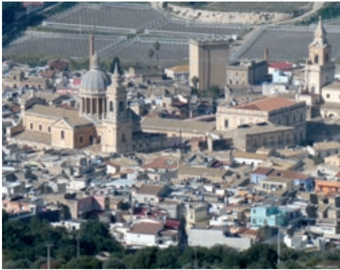
Club per l'UNESCO di COMISO