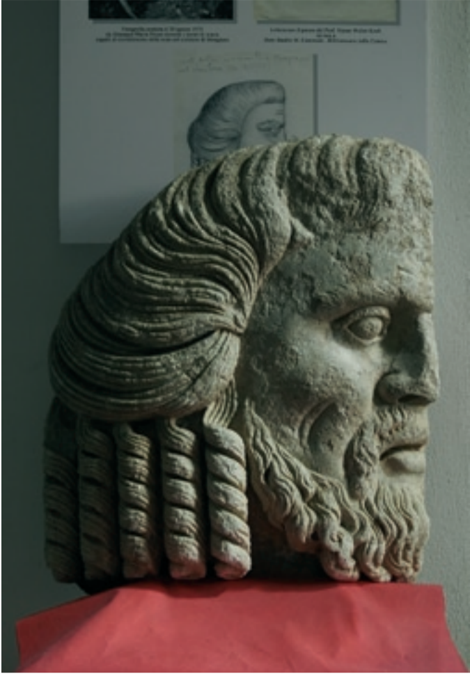
Club per l'UNESCO di REGGIO CALABRIA

Re Italo, il primo Re di Reggio, al quale lo storico Club è intitolato, 10 giugno 2018.