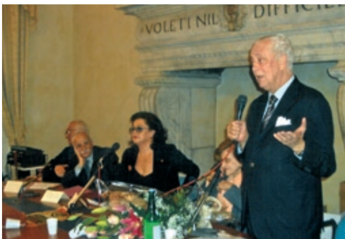
Club per l'UNESCO di FOLIGNO e Valle del Clitunno