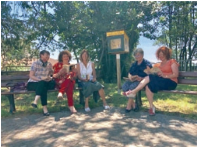
Club per l'UNESCO di VIGNALE MONFERRATO

La Presidente Nazionale incontra i soci giovani del Club per l'UNESCO di Verona, 3 ottobre 2016.