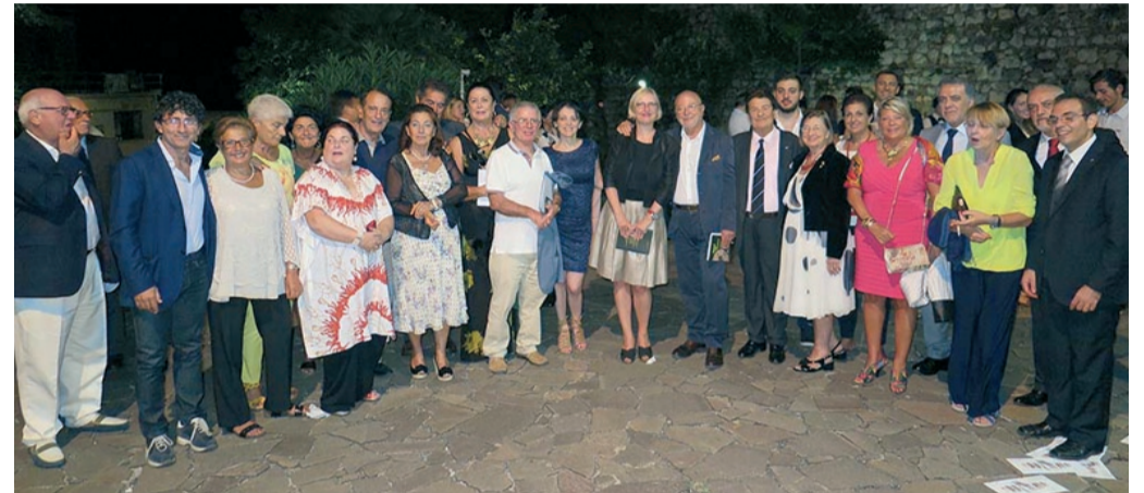
Club per l'UNESCO di TAORMINA, Valli d'Alcantara e d'Agrò

"La dieta Mediterranea Patrimonio Culturale Immateriale dell'Umanità UNESCO", presso Palazzo Duchi di Santo Stefano di Taormina e con la straordinaria partecipazione del Consiglio della FICLUe delle giornate ELEATICHE a cura della Fondazione ALARIO per la ELEA - VELIA Onlus e relativo Gemellaggio tra Comune di Taormina e di Ascea Elea Velia e relativi Club, 10-12 settembre 2015.