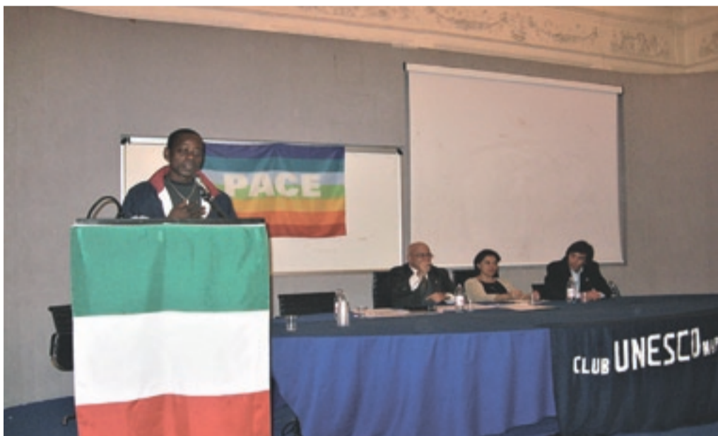
Club per l'UNESCO di NAPOLI

Corso di aggiornamento Progetto: "Scuola italiana, Scuola europea" per Dirigenti, Docenti, personale della Scuola, soci ed amici del Club, Praga, 21/28 aprile 2002.