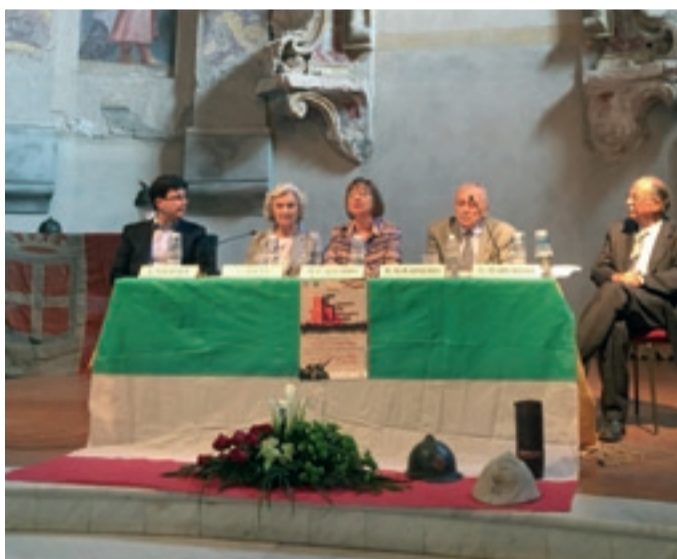
Club per l'UNESCO di CUNEO

Iniziativa in occasione del Centenario della Prima Guerra Mondiale, 13 maggio 2015.