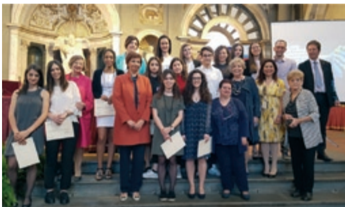
Centro per l'UNESCO di FIRENZE

Evento di inizio attività del Club, maggio 2016.