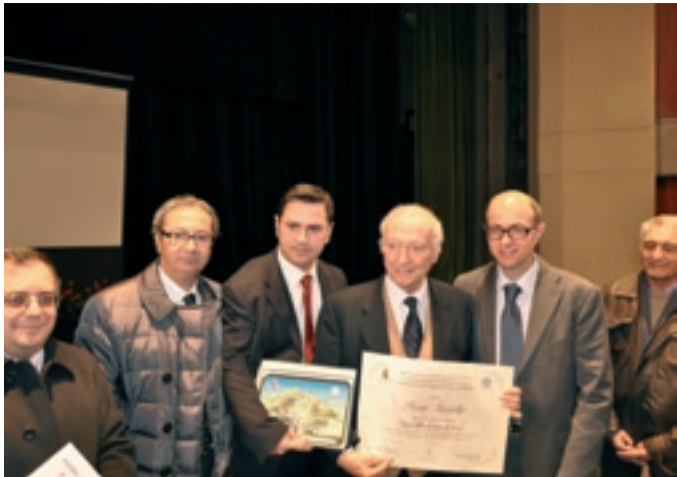
Club per l'UNESCO di ACIREALE

"Premio Sant'Alfio Fonte di Pace", 21 maggio 2011.