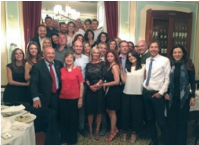
Club per l'UNESCO di VERONA

La Presidente Nazionale incontra i soci giovani del Club per l'UNESCO di Verona, 3 ottobre 2016.