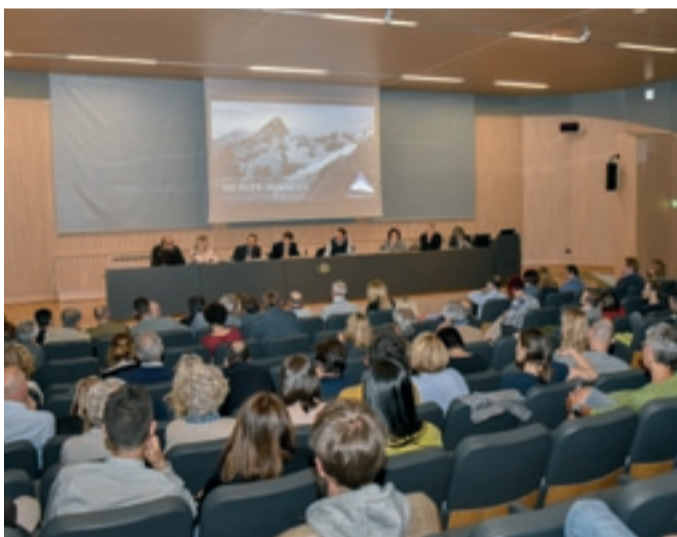
Club per l'UNESCO di AOSTA

Courmayeur, convegno sull'iscrizione al PATRIMOINE MONDIAL del Monte Bianco, in compartecipazione con l'Espace Mont Blanc, 6 giugno 2018.