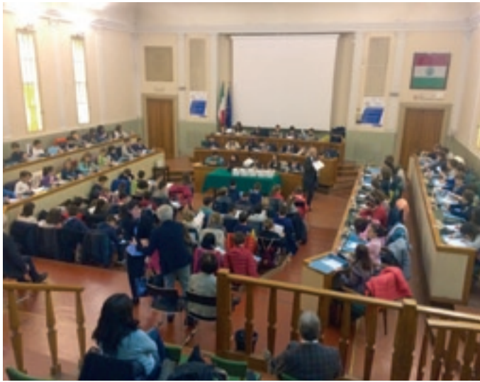
Club per l'UNESCO di FERRARA

Le belle tasse: i ragazzi insegnano il "buon governo" in Consiglio Comunale, 8 novembre 2016.