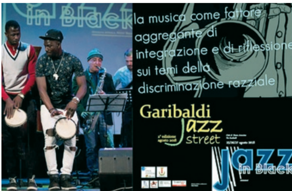
Club per l'UNESCO di PIAZZA ARMERINA

"Colori e Pace", Mostra Convegno "Italia-Napoli-Brasile San Paolo", 4-6-7-8 ottobre 2008.