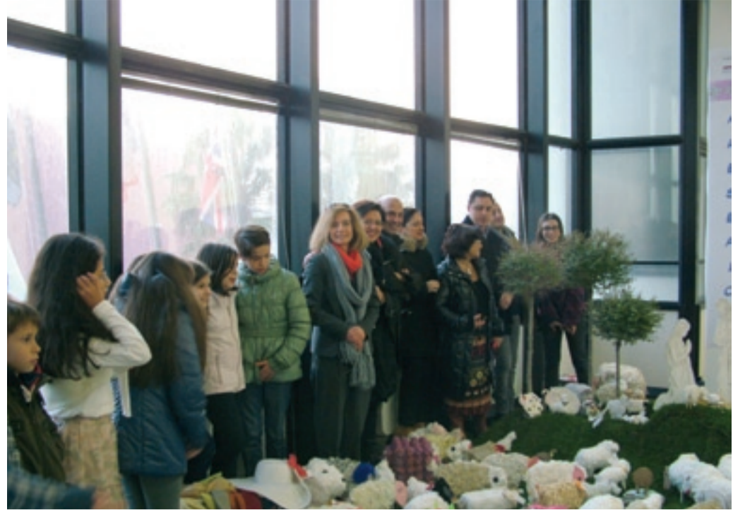
Club per l'UNESCO di SAN BENEDETTO DEL TRONTO

Re Italo, il primo Re di Reggio, al quale lo storico Club è intitolato, 10 giugno 2018.