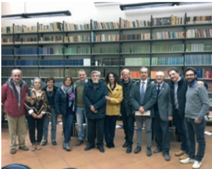
Club per l'UNESCO di AMALFI

Presentazione del Club per l'UNESCO di Amalfi, con i soci fondatori, dicembre 2016.