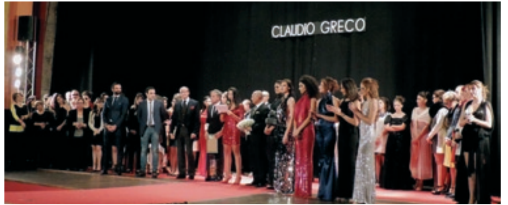
Club per l'UNESCO di GIOIOSA JONICA

Le belle tasse: i ragazzi insegnano il "buon governo" in Consiglio Comunale, 8 novembre 2016.