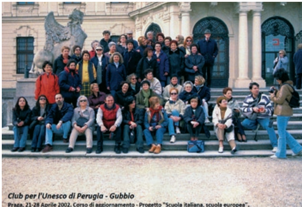
Club per l'Unesco di Perugia - Gubbio