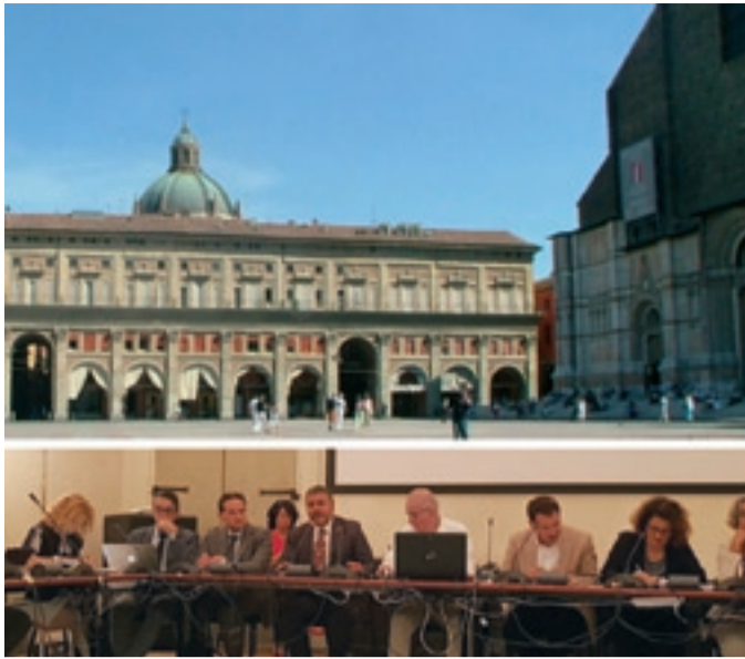
Club per l'UNESCO di BOLOGNA

Conferenza presso il Comune di Bologna per la candidatura UNESCO dei "Portici di Bologna", settembre 2018.